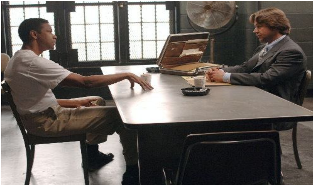
Interrogatorio tra Frank Lucas e l'ispettore Roberts