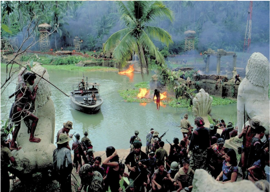
Quartier generale del Colonnello Kurtz